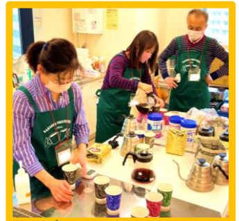
パリスラボボランティアがおいしいコーヒーを入れてくれます。コーヒーサロンも同時開催します。

哲学カフェとは当日のテーマに沿って参加者同士で対話をする集いです。対話によって生まれた「問い」についても参加者で考えを深めます。