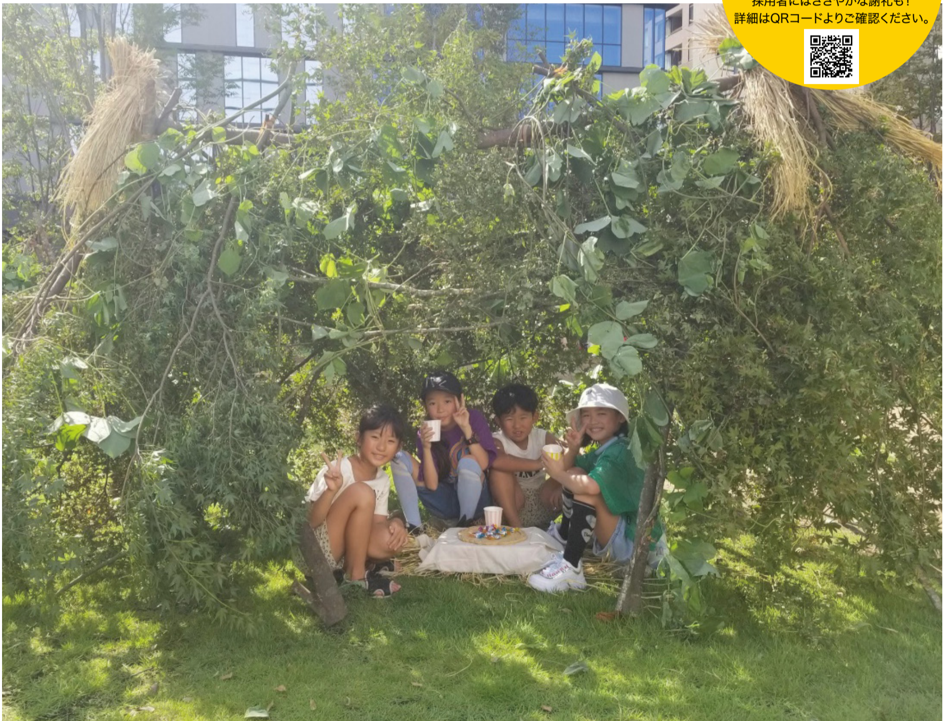
【タイトル】秘密基地 【撮影場所】番町の森