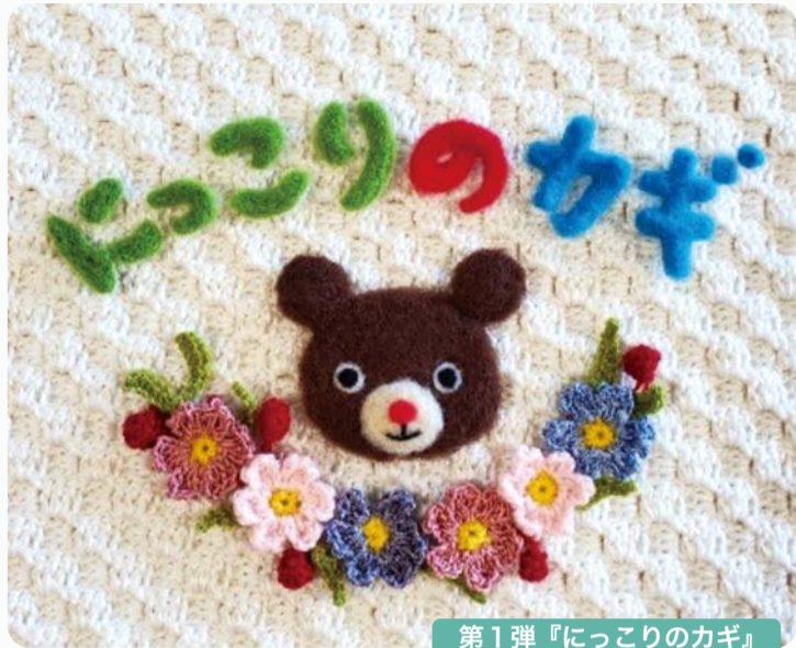
第1弾『にっこりのカギ』