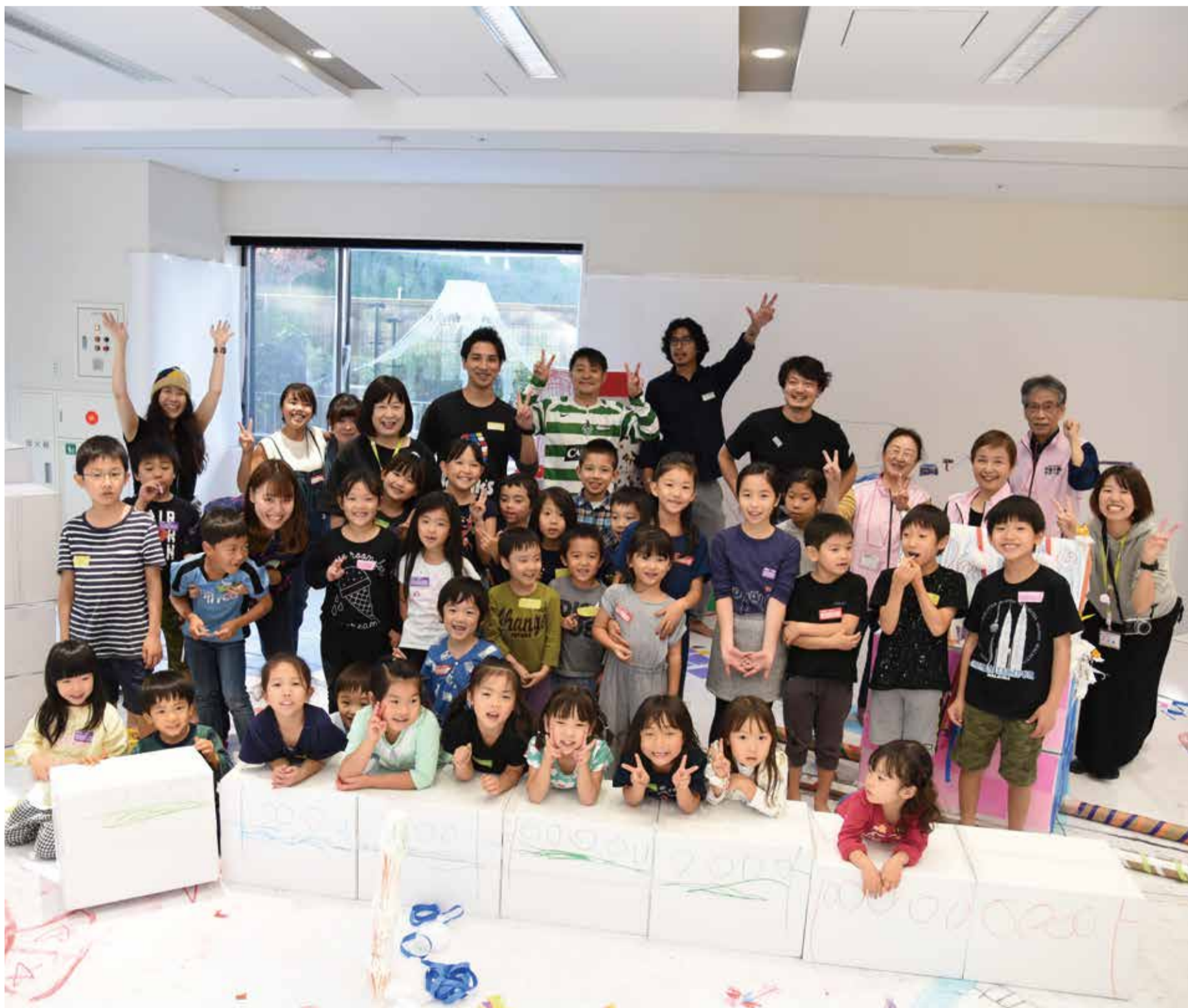
11月4日実施。ちよだで多世代交流 Ciao「ちよだを描こう」 ひだまりホールが真っ白なキャンパスになりました。