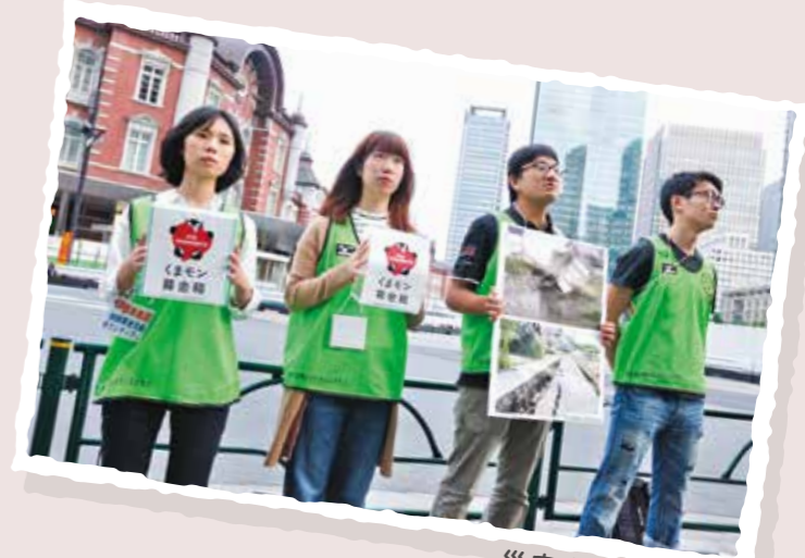
災害支援募金活動