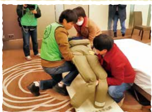
帰宅困難者対応訓練を行うことで、 いざという時の対応を学びます。

災害時に連携できるつながり ちよだモデルネットワーク (通称: CMN) ・日ごろから顔が見える、ゆるやかなつながり作り ・災害に関する学習会や講座の開催 ・災害時の具体的な支援行動指針(動き方)の編さん