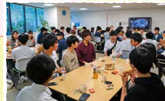
区内に通う大学生同士が学校の垣根を越えての交流。地域の大きな活力となっています。