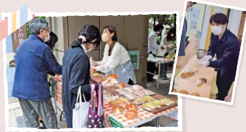
障がい者施設でのパン販売サポート