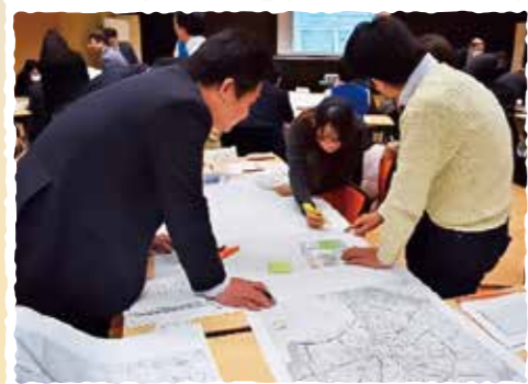
在勤者が地域にどのような支援ができるかを考えるワークショップの開催。