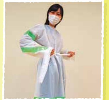
防護服を手作りして、区内の医療従事者に届けました。

子どもたちの勉強のお手伝いもしています！ ちよだの学生の皆さんも一緒に♪ 区内に通う学生たちも、地域の清掃活動や子どもたちの遊び相手、障がいへの理解、多世代交流など楽しみながら取り組んでいます。