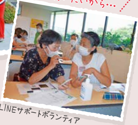
LINEサポートボランティア