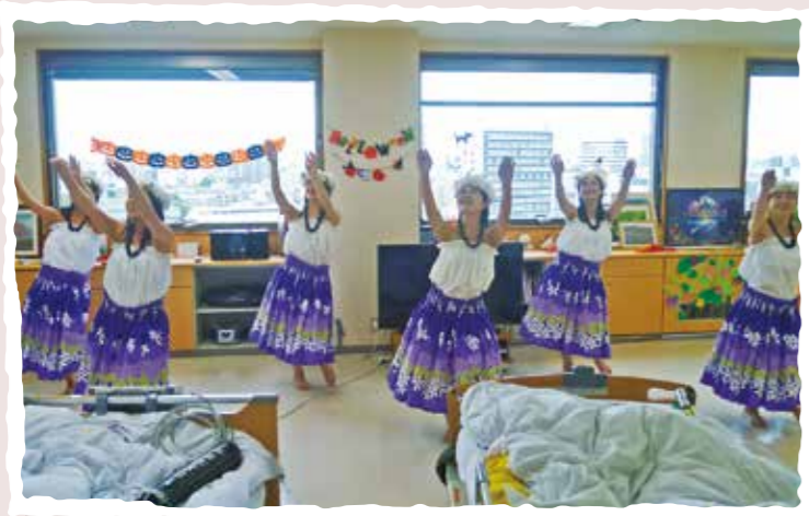
学生グループによるフラダンスの披露