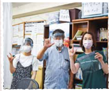
フェイスシールドの制作寄付(企業ボランティア)