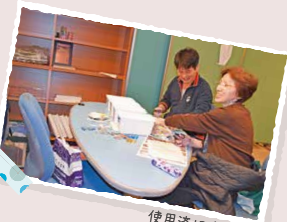
使用済切手の整理