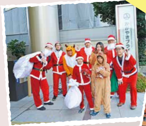
企業によるサンタクロースボランティア