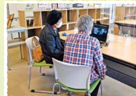
話を聴いて、寄り添う(傾聴)ボランティア。 コロナ禍で直接会えない時でも、 オンラインで行いました。