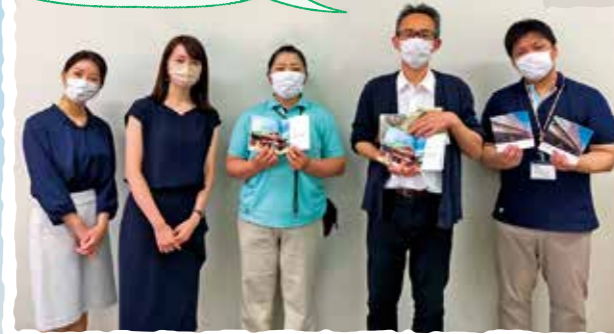
高齢者施設に自然やちよだの風景を収めた 手作りのフォトブックをプレゼントしました。