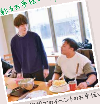
高齢者施設でのイベントのお手伝い