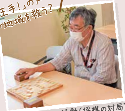
趣味を活かした活動(将棋の対局)