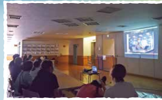
区内の障がい児支援事業に通う子どもたちを対象に、オンラインで企業見学を行いました。

企業のチカラでまちを元気に！ 区内の多様な分野の企業が手を取り合い、区内の高齢者・障がい者施設などで社会貢献活動を行っています。また、区内企業のみなさんと連携した活動ができるようにネットワークづくりを行っています。 (ちよだ企業連絡会=ち企連)