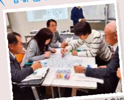
勤務地周辺のハザードマップ確認