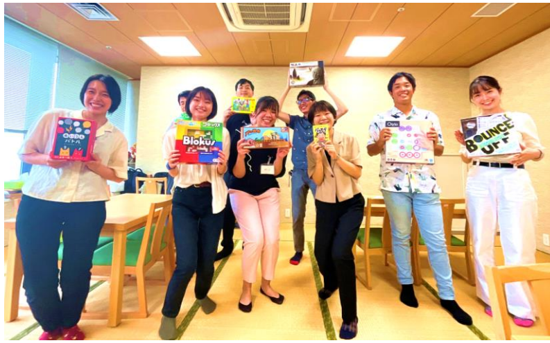
ルールを教えてくれる 学生のみなさん