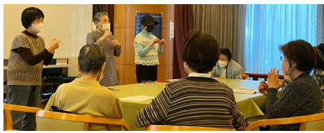
▲手話の発表を行っている様子

なぜ?と疑問に思うことや、気になったことをすぐに先生に聞くことができるので、とても好評です。ぜひ皆さんもチャレンジしてみてくださいいかがでしょうか。