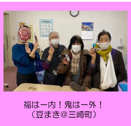
福は一内！鬼は一外！ (豆まき@三崎町)