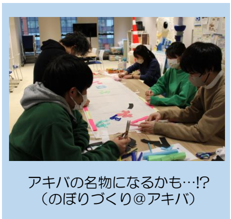
アキバの名物になるかも…!? (のぼりづくり@アキバ)

写真で振り返る 二月のプログラム 今月もいろいろなプログラムを 予定しています。お楽しみに！