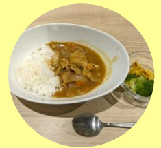
▲カレー(季節により 具材は異なります)