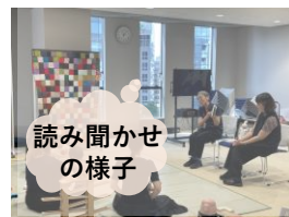
読み聞かせ の様子