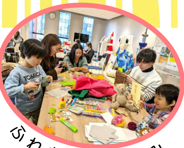
ふれあい・楽しみ

ボランティアが運営する「ふれあいサロン」やボランティアと社協職員が運営する「はあとサロン」「みんなのサロン」等の地域の居場所情報を毎月お届け！