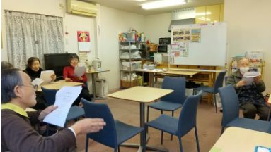
▲「みんなで歌おう」の様子

また、三崎町はあとサロンでは、中国武術の要素を取り入れた健康教室も開催しています。今後参加者の方やボランティアの方たちとプログラムを開催していきます。