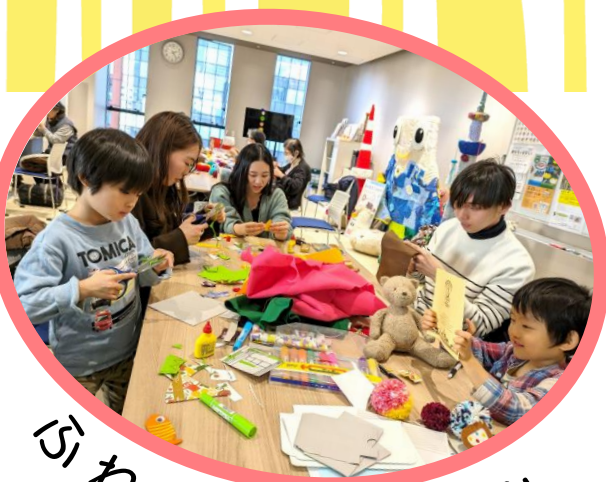
ふれあい・楽しみ

ボランティアが運営する「ふれあいサロン」やボランティアと社協職員が運営する「はあとサロン」「みんなのサロン」等の地域の居場所情報を毎月お届け！